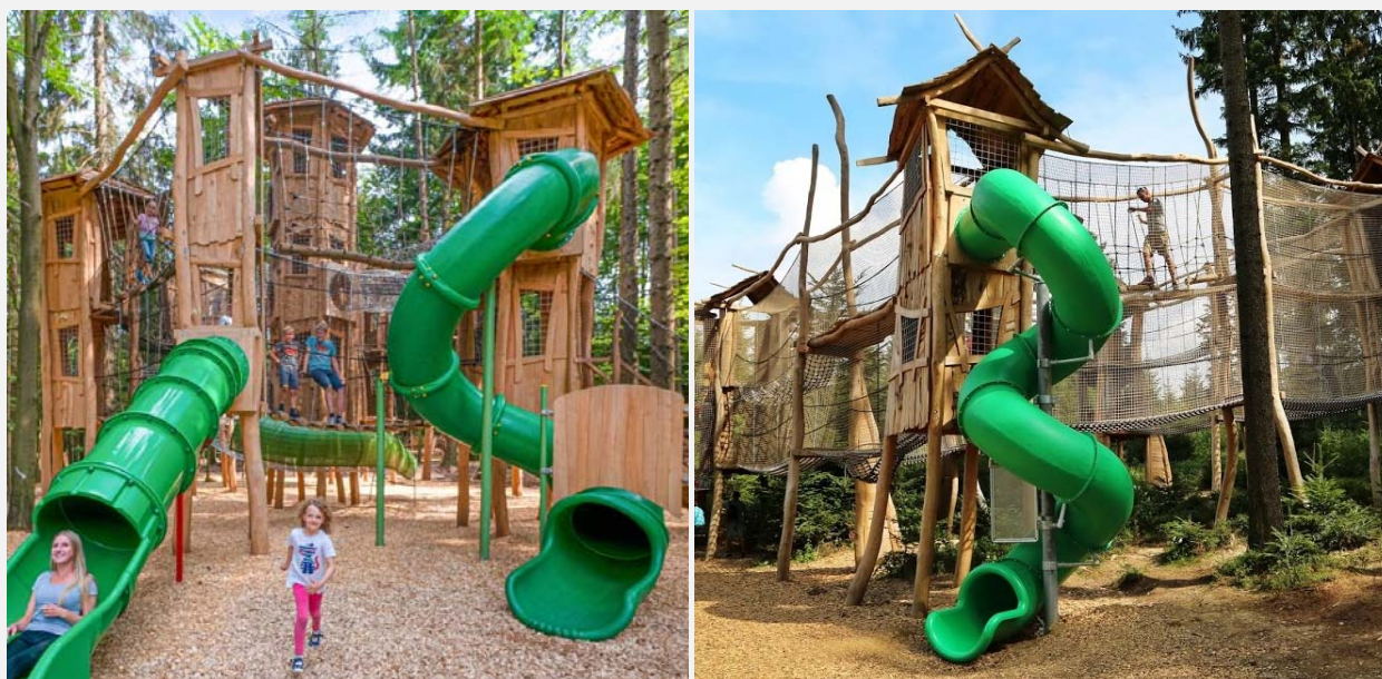
ABBILDUNG 2: ABENTEUERSPIELPLÄTZE DER ERLEBNIS AKADEMIE: SCHWARZWALD (LS) UND LIPNO (RS)