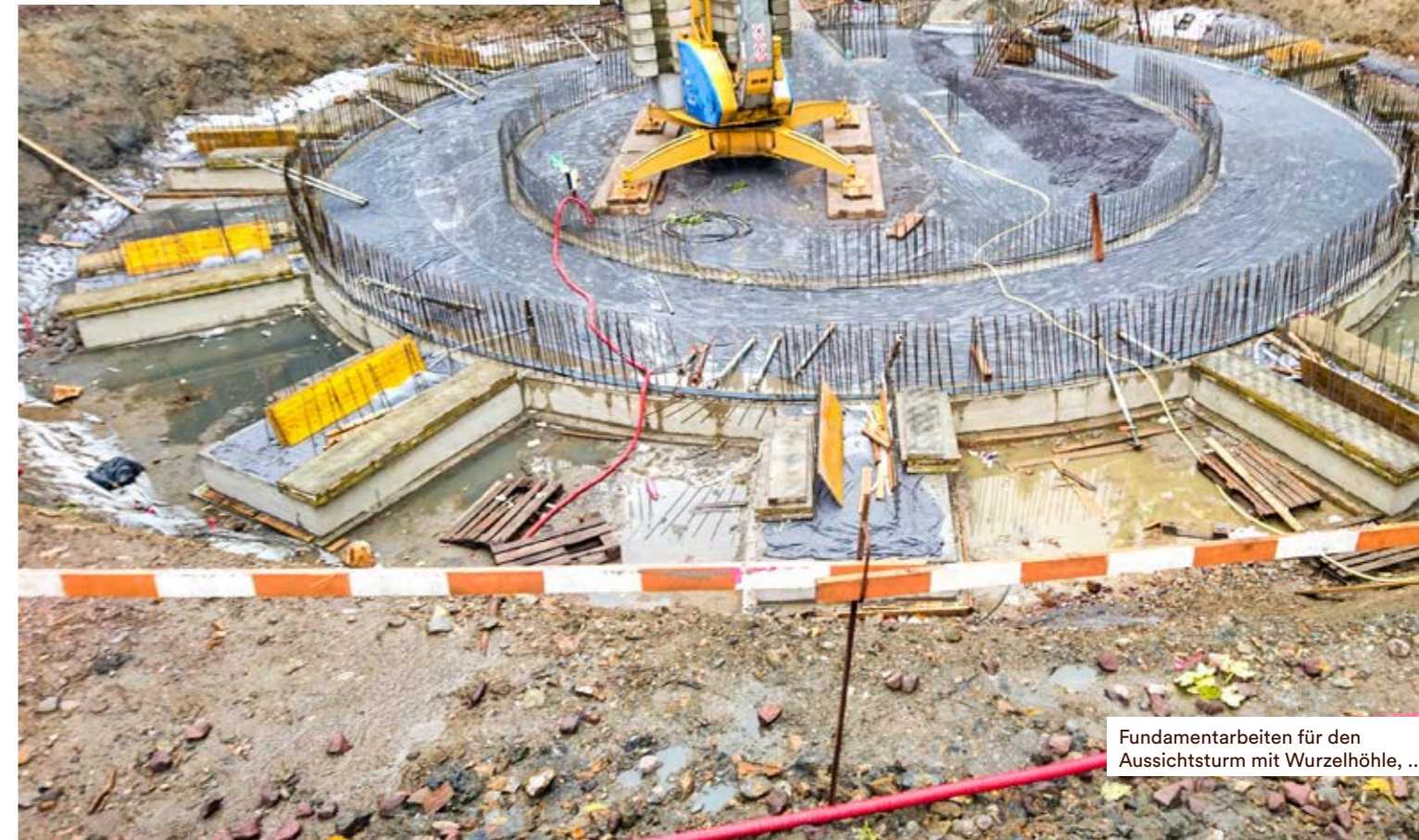
Fundamentarbeiten für den Aussichtsturm mit Wurzelhöhle, ...