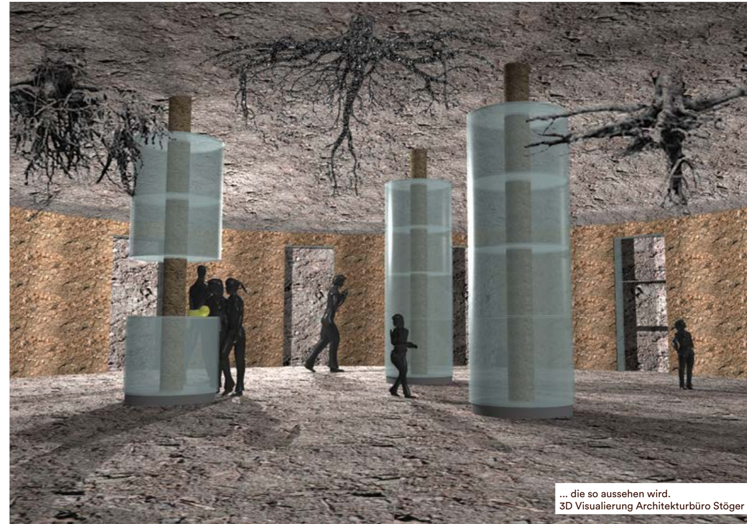
... die so aussehen wird. 3D Visualisierung Architekturbüro Stöger