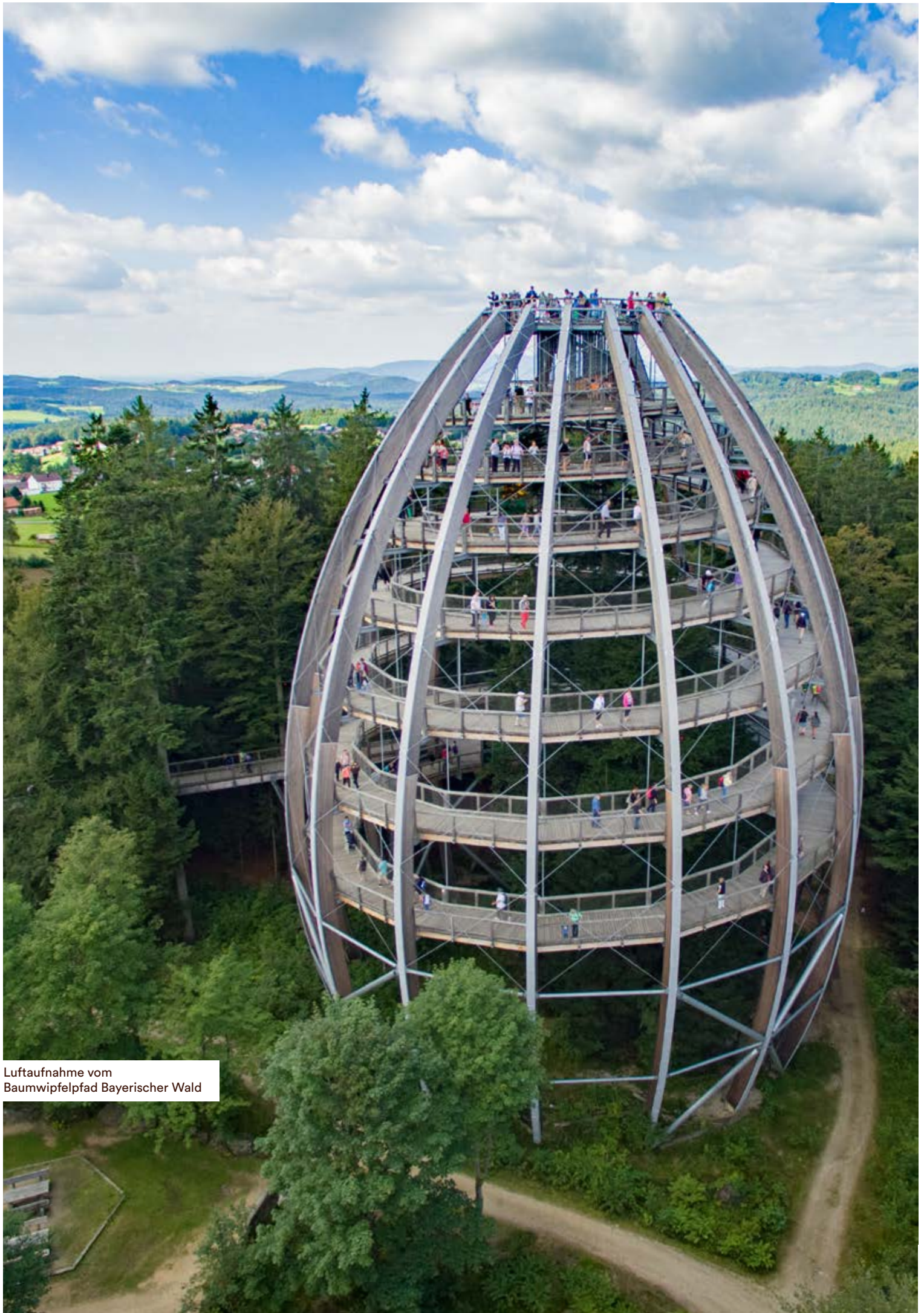
Luftaufnahme vom Baumwipfelpfad Bayerischer Wald