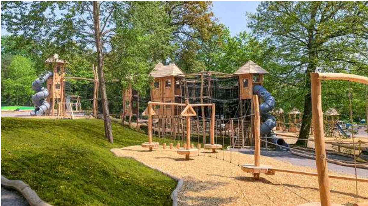
Der jüngst eröffnete „Abenteuerwald Elsass“ in Drachenbronn-Bierlenbach

Ein weiteres Standbein und Angebot der eak sind die in den Wald integrierte Erlebnisspielplätze, die „Abenteuerwälder“ : In landschaftlich reizvoll gelegenen Regionen können hier